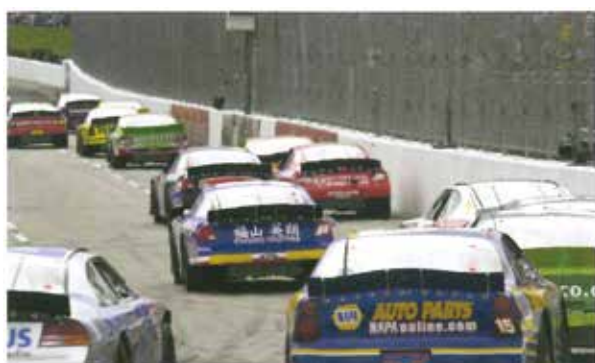
ライバルは前後左右に…

これにより、もし自分の真横に後続車が停車した際には、その後続車に10m以上の停止距離をプレゼントした事になりますが、この際に助かったのはその人だけではありません。もちろん、自らと同乗者の命も守った事になります。