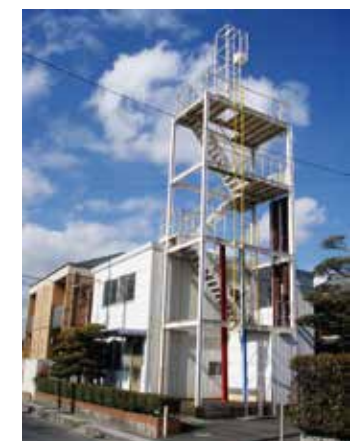
自宅の実験塔(撤去済)