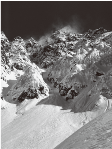
厳冬期の前穂高岳

なぜ人は山に登るのだろうか。「そこに山があるから」この言葉は良く知られている。重い荷物を運んで歩む道のり、危険と隣り合わせの岩壁、それでもなお山に人を駆り立てるのは何なのだろうか。石岡繁雄は著作『屏風岩登攀記』でこう綴っている。「登山というのは、しよせんタート(行)の世界である」と。